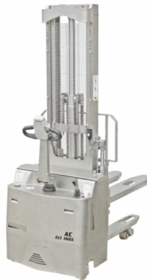
Pedana operatore con protezioni