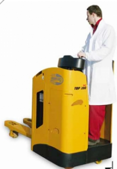
Larghezza telaio mm. 770

Carrello trasportatore elettrico uomo a bordo in piedi per usi intensivi e carichi/scarichi automezzi