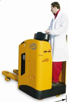
Larghezza telaio mm. 770

Carretilla transportadora eléctrica con operador a bordo de pie para usos intensivos y cargas/descargas